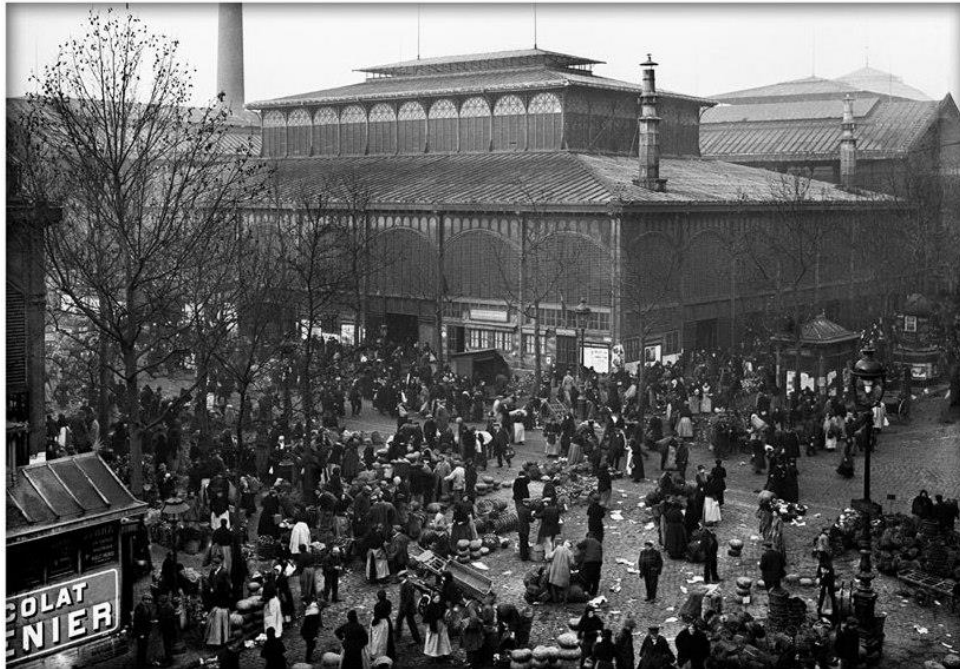
Een van de paviljoenen van de Hallen, een magneet in het stadsleven (foto 1916)