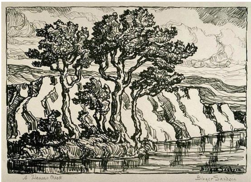
Sven Birger Sandzén; A Kansas creek , 1931 (litho)