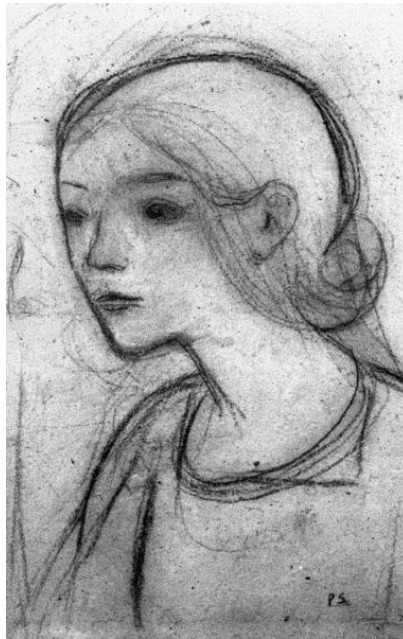
Paul Sérusier; Jonge Bretonse, c1890

In de loop van alle jaren gingen 120 schepen verloren. Tachtig daarvan vergingen met man en muis. Andere raakten zwaar gehavend tijdens stormen of aanvaringen in de mist. Zeelieden konden dan verwond raken of overboord slaan. Jonge jongens konden op hun eerste reis al het leven verliezen. Oudere vissers die ( net als hun familieleden ) reeds een werkleven met de onzekerheid hadden geleefd konden op latere leeftijd alsnog verongelukken. Toch is zeker van één visser bekend dat hij 40 campagnes meemaakte. Onderwijl beleefde hij nooit een Franse zomer. Het leven was grijs en mistig op zee, thuis was 's winters de natuur in diezelfde tinten teruggevallen. Een enkele maal slaagde een marineschip erin post uit te wisselen tussen het thuisfront en de vissers, maar vaak bleef