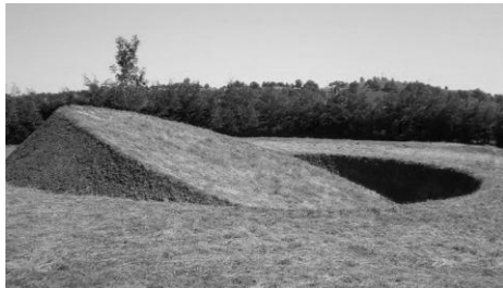
afb.: Tanya Preminger; environmental art project 'Round Balance', 2008

De bewerking van onze planeet is het verhaal van de drie lagen: 'Na de oppervlaktelaag en de luchtlagen komen de aardlagen aan de beurt'. Over gevolgen van grondstofwinningen in de mijnbouw, geothermie, fracking, ondergrondse opslagen, ambitieuze ondergrondse projecten, chemische bodeminfiltaties, mechanische bewerkingen van bodem en zeebodem.