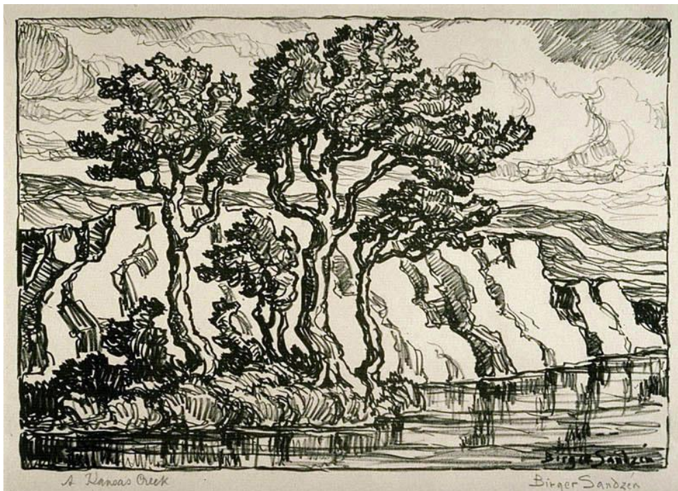
Sven Birger Sandzén; A Kansas creek, 1931 (litho)