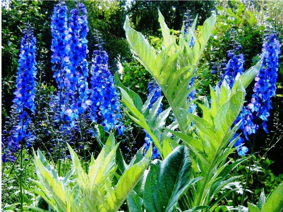
De Walburg Nuenen; zomers kleurvertoon onder licht en tegen schaduw

tot de beslotenheid toelaat. “De mens waant de buitenwereld hier buitengesloten in een ideale paradijslijkheid”. In deze tuin zou men het kunnen beschouwen als kamers, nog binnen het groter geheel van de “omsloten kamer” Walburg. De dubbele bordertuin is georiënteerd op het woonhuis en het terras. Met planten welke opeenvolgend bloeien, willen de beheerders aan alle seizoenen kleur geven, een vinding van de Engelse Gertrude Jekyll. Het vereist een bewerkelijke en intensieve zorg. De grassentuin toont de luchtige werking van siergrassen. De moestuin brengt de kloostertuin in herinnering waar groenten, kruiden en fruit voor consumptief gebruik werden geteeld. Voor de monniken had dit werk een spirituele betekenis. In de bekoorlijkste omgeving was het de eigen aardse arbeid die bijdroeg aan het mysterieuze proces van de groei. Onder Gods hoede.